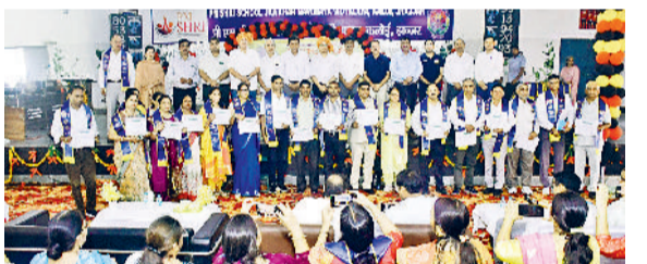
झज्जर। कार्यक्रम के दौरान उपस्थित सम्मानित प्राचार्य, मुख्यातिथि एवं अन्य।

शिक्षकों को जिला स्तरीय उत्कृष्ट शिक्षक सम्मान दिया गया। एसडीएम ने अपने संबोधन में शिक्षकों की भूमिका को राष्ट्र निर्माण की आधारशिला बताते हुए कहा कि शिक्षक केवल पाठ्यक्रम नहीं पढ़ाते, वे आने वाली पीढ़ियों को संस्कार, मूल्य और दिशा प्रदान करते हैं। इस अवसर पर सांस्कृतिक कार्यक्रम, कविताएं, और विद्यार्थियों द्वारा शिक्षकों के प्रति आभार प्रदर्शन भी प्रस्तुत किया गया, जिसने समारोह को भावनात्मक और प्रेरणादायक रूप दिया।