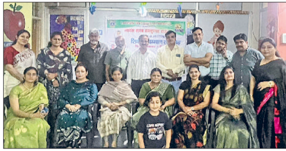
बहादुरगढ़। कार्यक्रम में मौजूद शिक्षक व क्लब के पदाधिकारी।