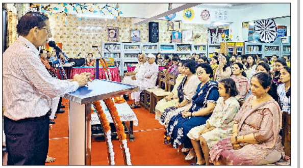
बहादुरगढ़। डीएवी स्कूल में हुए कार्यक्रम को संबोधित करते अतिथि।