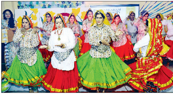
झज्जर। कार्यक्रम में हरियाणवी नृत्य की प्रस्तुति देते हुए विद्यार्थी।