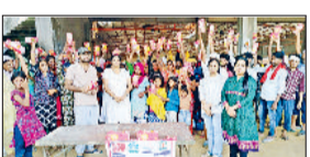
झज्जर। प्रवासी श्रमिकों व उनके बच्चों के साथ संस्था सदस्य।