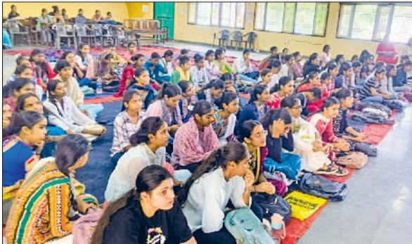
बहादुरगढ़। कार्यक्रम में उपस्थित राजकीय गर्ल्स कॉलेज की छात्राएं।

शिक्षकों को जिला स्तरीय उत्कृष्ट शिक्षक सम्मान दिया गया। एसडीएम ने अपने संबोधन में शिक्षकों की भूमिका को राष्ट्र निर्माण की आधारशिला बताते हुए कहा कि शिक्षक केवल पाठ्यक्रम नहीं पढ़ाते, वे आने वाली पीढ़ियों को संस्कार, मूल्य और दिशा प्रदान करते हैं। इस अवसर पर सांस्कृतिक कार्यक्रम, कविताएं, और विद्यार्थियों द्वारा शिक्षकों के प्रति आभार प्रदर्शन भी प्रस्तुत किया गया, जिसने समारोह को भावनात्मक और प्रेरणादायक रूप दिया।