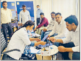
बहादुरगढ़। रॉयल ग्रीन काउंटी में लगे फैंप में लोगों की जांच करते स्वास्थ्यकर्मी।