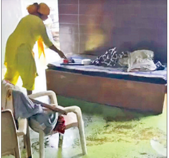
झज्जर। मकान में हुए जलभराव के बीच सामान निकालती महिला।

झज्जर। बरसात के कारण हुए जलभराव ने लोगों का जीना मुहाल कर रहा है। शहर के देवनगर की स्थिति यह है कि बरसाती पानी लोगों के घरों में घुस गया है। जिसके कारण जहां घरों में रखा सामान खराब हो गया है, वहीं दीवारों और फर्शों में आई बड़ी बड़ी दरारों के कारण दुर्घटना होने का अंदेश बना हुआ है। शुक्रवार को जलनिकासी का कार्य रूकवा दिए जाने पर लोगों में आक्रोश बन गया और लोग सड़कों पर उतर आए। लोगों का कहना है कि प्रशासनिक स्तर पर जलनिकासी की व्यवस्था की गई थी। लेकिन शुक्रवार को नप बहादुरगढ़ में कार्यरत किसी अधिकारी ने जलनिकासी का कार्य रूकवा दिया। जिसके कारण उन्हें सड़कों पर आना पड़ा। बाद में मामले की सूचना डीएससी और डीसी को दी गई। जिन पर कार्रवाई करते हुए नप टीम मौके पर पहुंची और देबारा से जल निकासी की व्यवस्था करवाई गई। लोगों ने पानी निकासी कार्य रूकवाने वाले अधिकारी को लिखित भी शिकायत भी दी है। लोगों का कहना है कि अगर जल्द निकासी नहीं की गई तो मकान गिरने की कगार पर आ जाएंगे।