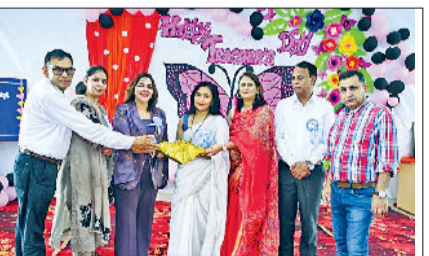
झज्जर। झज्जर। शिक्षकों को सम्मानित करते हुए स्कूल प्रबंधन समिति सदस्य।